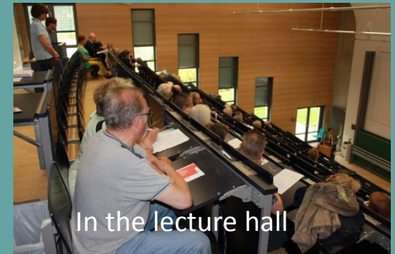
In the lecture hall