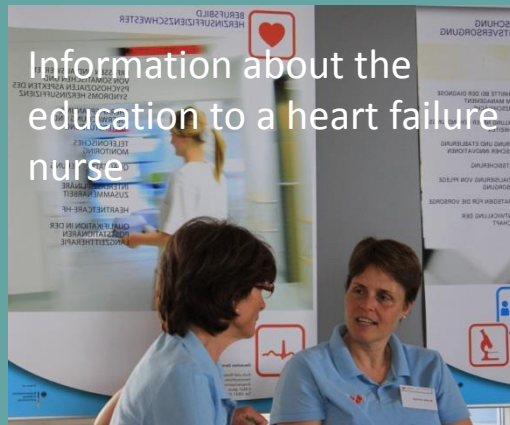
Information about the education to a heart failure nurse