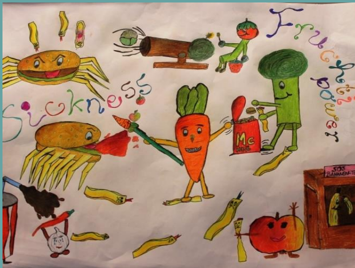
Fabiana: „Sickness against fruitpower“