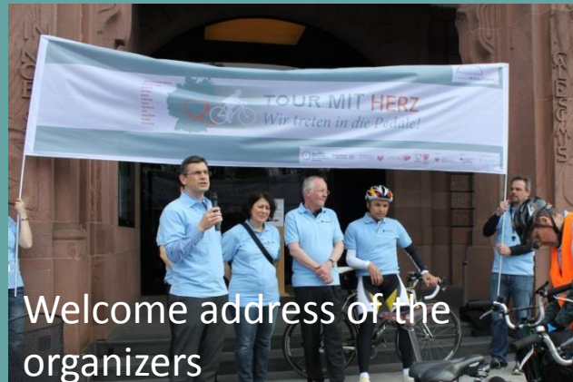
Welcome address of the organizers