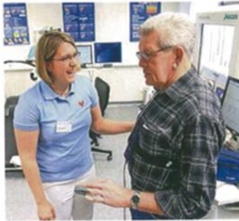
Untersuchung eines Patienten im Deutschen Zentrum für Herzinsuffizienz in Würzburg.

Herzinsuffizienz Etwa zwei bis drei Millionen Menschen bundesweit leiden an Herzinsuffizienz. Vor allem ältere Menschen sind betroffen. Durch die Alterung der Gesellschaft hat sich die Krankheit in den vergangenen Jahren zu einer Volkskrankheit entwickelt. Meist verläuft sie chronisch fortschreitend. Da das Herz in vielfältigen Wechselwirkungen mit anderen Organen steht, ist die Herzschwäche eine Erkrankung, die die ganzen Menschen betrifft. rgs-p