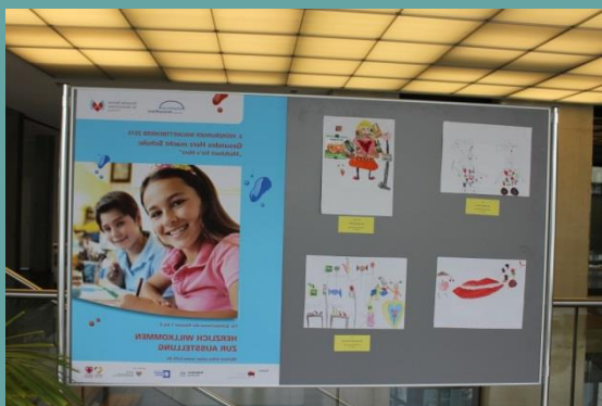
Exposition with art works