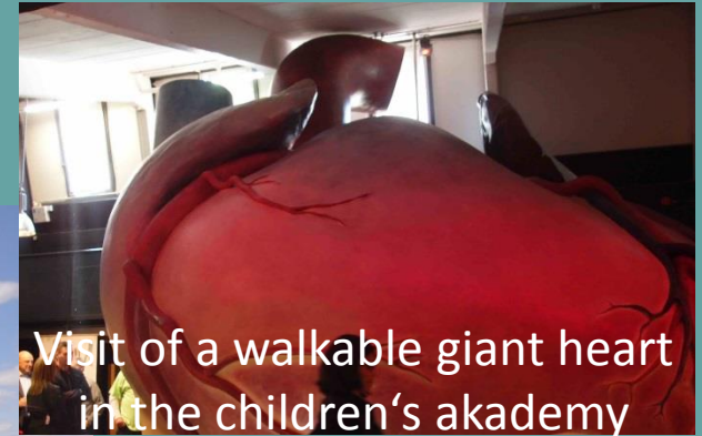
Visit of a walkable giant heart in the children's academy