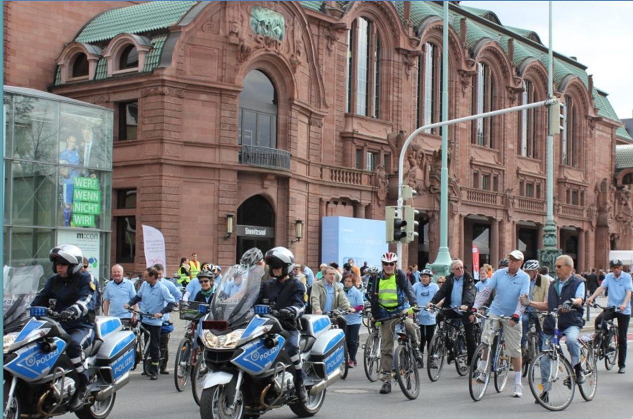
Start in Mannheim

Take Cycling at Heart (11.04. – 10.05.2015)