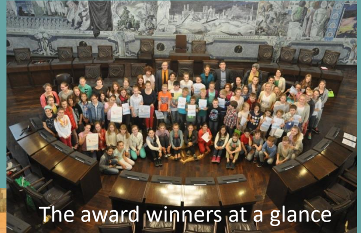
The award winners at a glance