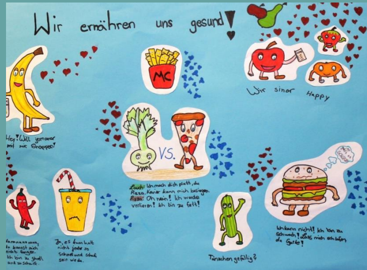
Emily and Sabrina: „We eat only the healthiest foods!“