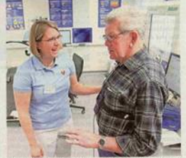
Untersuchung eines Patienten im Deutschen Zentrum für Herzinsuffizienz in Würzburg.

Einen wichtigen Beitrag zur Aufklärung über die Krankheit leistet der Europäische Tag der Herzschwäche (EHTA Day), der 2015 bereits zum fünften Mal stattfindet. Im Rahmen verschiedener Aktionen und Veranstaltungen soll dabei von 8. bis 10. Mai auf das Problem Herzschwäche aufmerksam gemacht und für einen gesunden