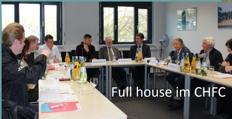
Full house im CHFC