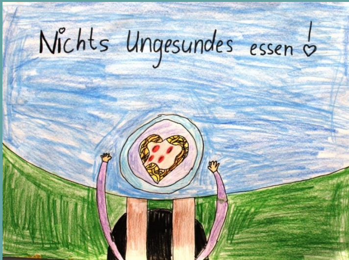
Lia: „Don't eat unhealthy food!“