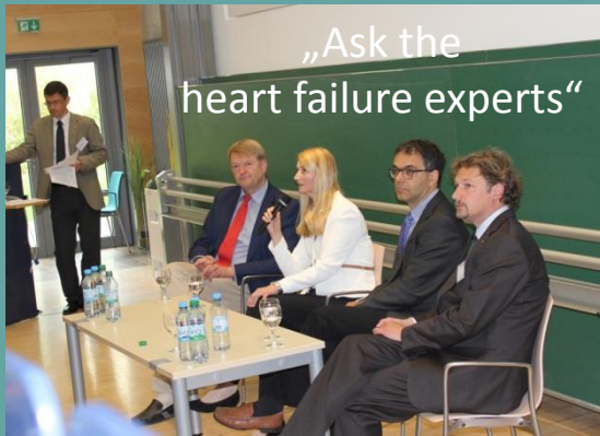
„Ask the heart failure experts“