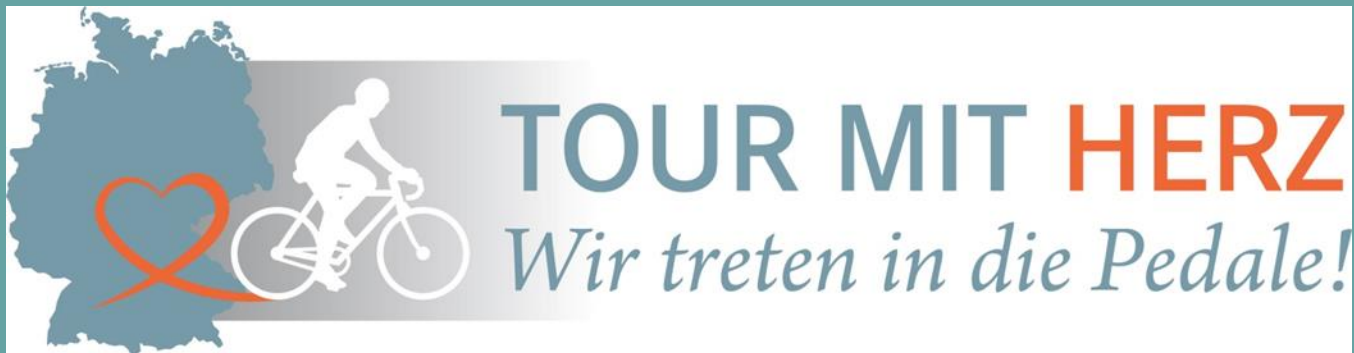
Logo of the campaign