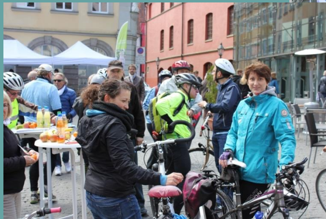
After the tour