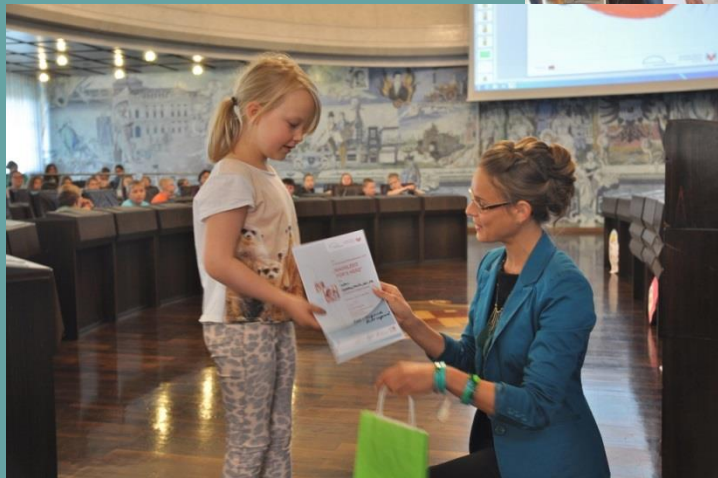
All artists receive a certificate and a present