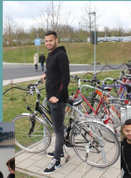
Biking instead of soccer