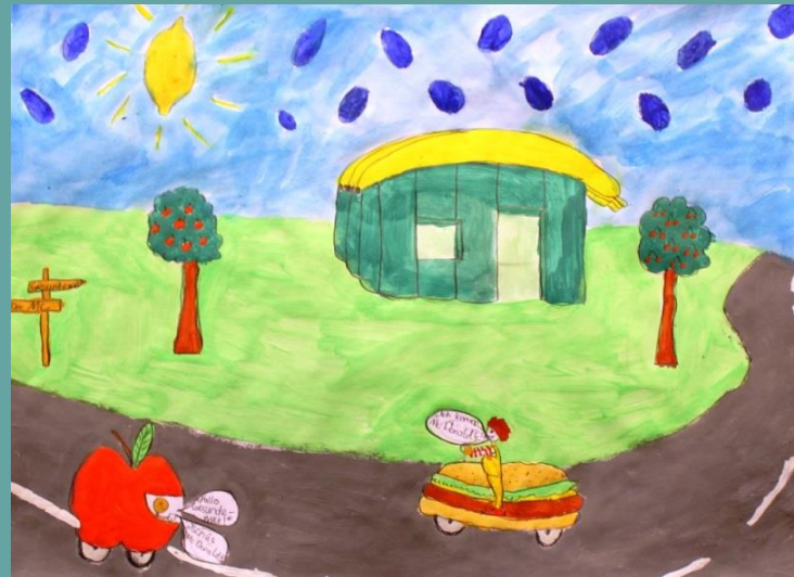
Alina: „Good bye McDonald's!“