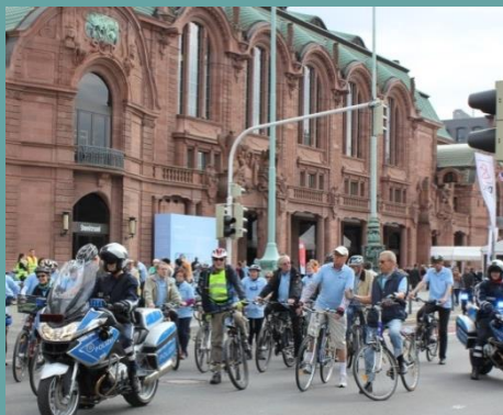
Start in Mannheim