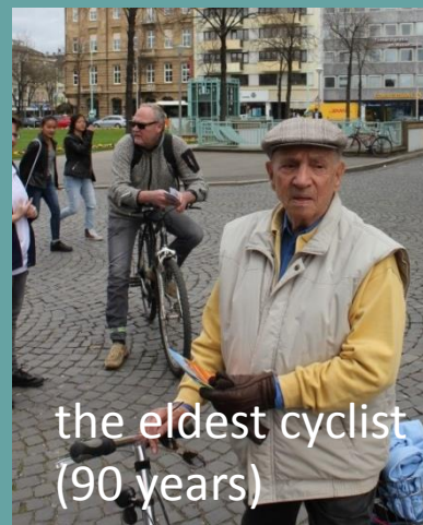
the eldest cyclist (90 years)