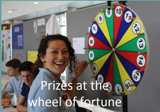
Prizes at the wheel of fortune