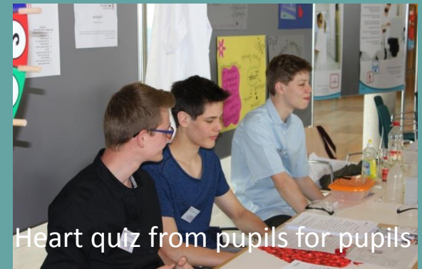
Heart quiz from pupils for pupils