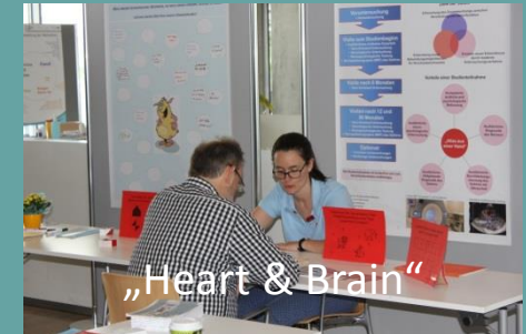
„Heart & Brain“