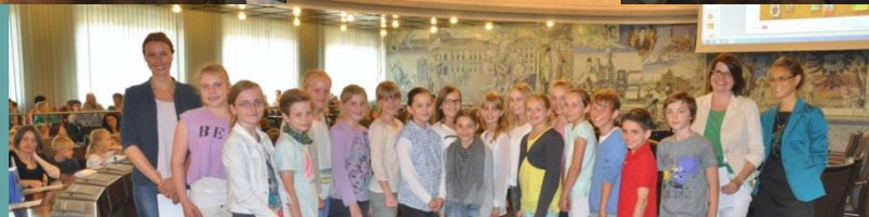
The ceremony took part in the Mayor's hall