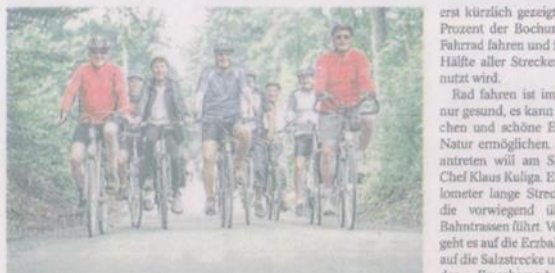
Über ehemalige Bahntrassen führt die „Tour mit Herz“ am kommenden Samstag. Das Katholische Klinikum und der ADFC laden ein.

Die „Tour mit Herz“ ist eingebettet in den „Europäischen Tag der Herzschwäche“. Europaweit finden im April und Mai Veranstaltungen statt,