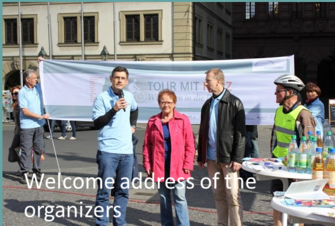
Welcome address of the organizers