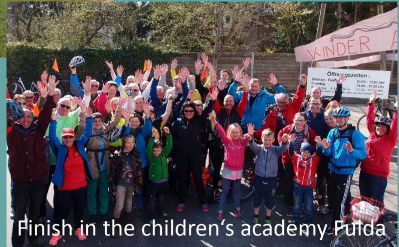
Finish in the children's academy Fulda