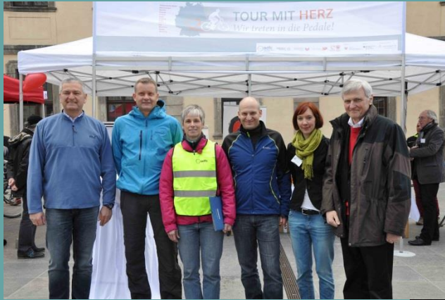
The organisational team in Fulda