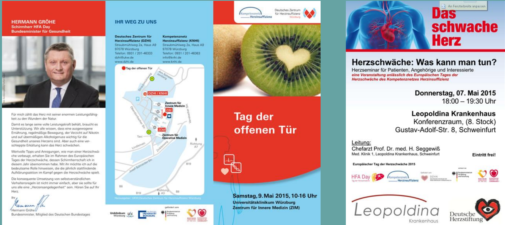
Program flyers for different patient events