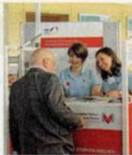
Am „HFA-Day“ können sich Besucher informieren.