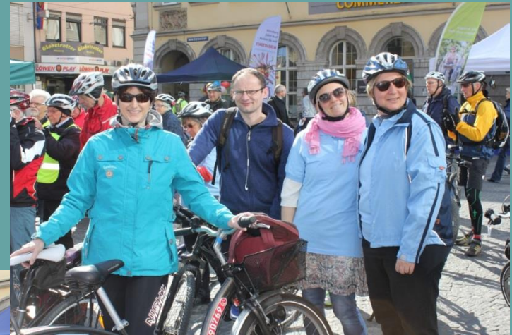
Before the start