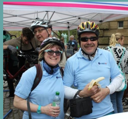
Targeting healthy food